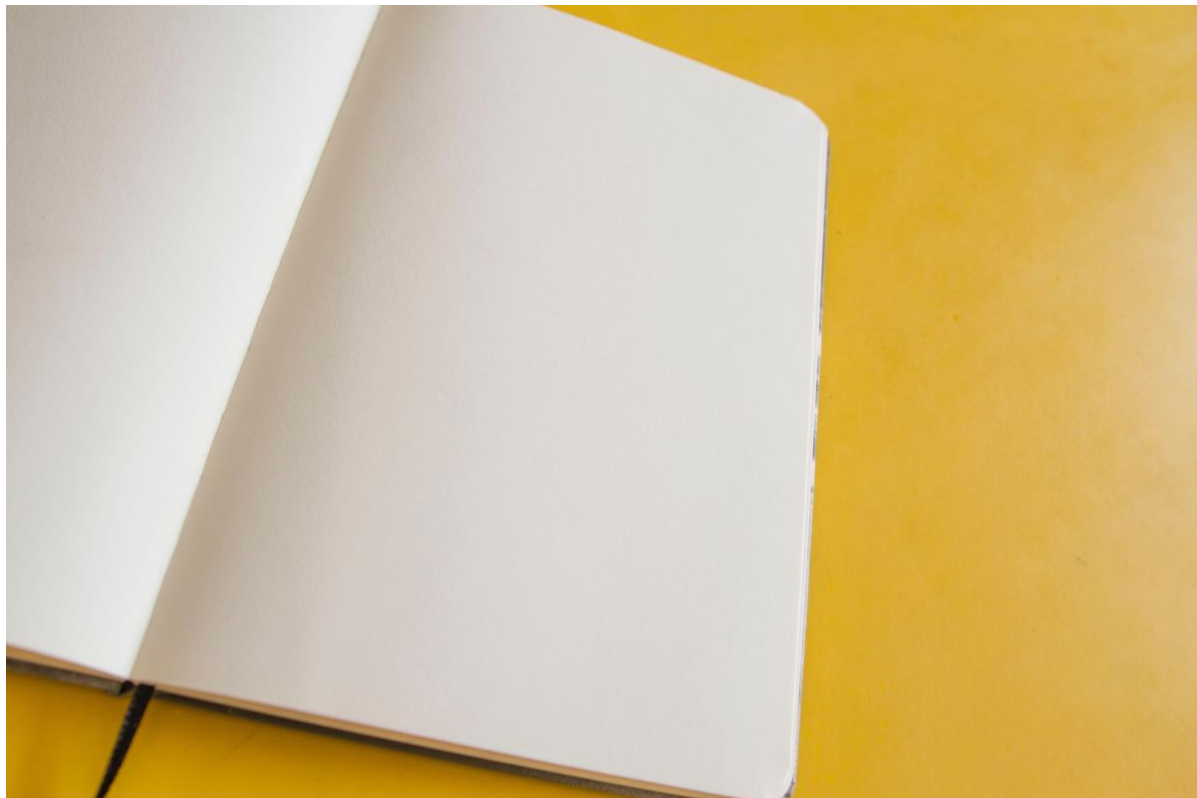
Figur 2.

Alla tjänster som listas i det här avsnittet innehåller bilder och material som är gratis att använda och som inte behöver refereras.