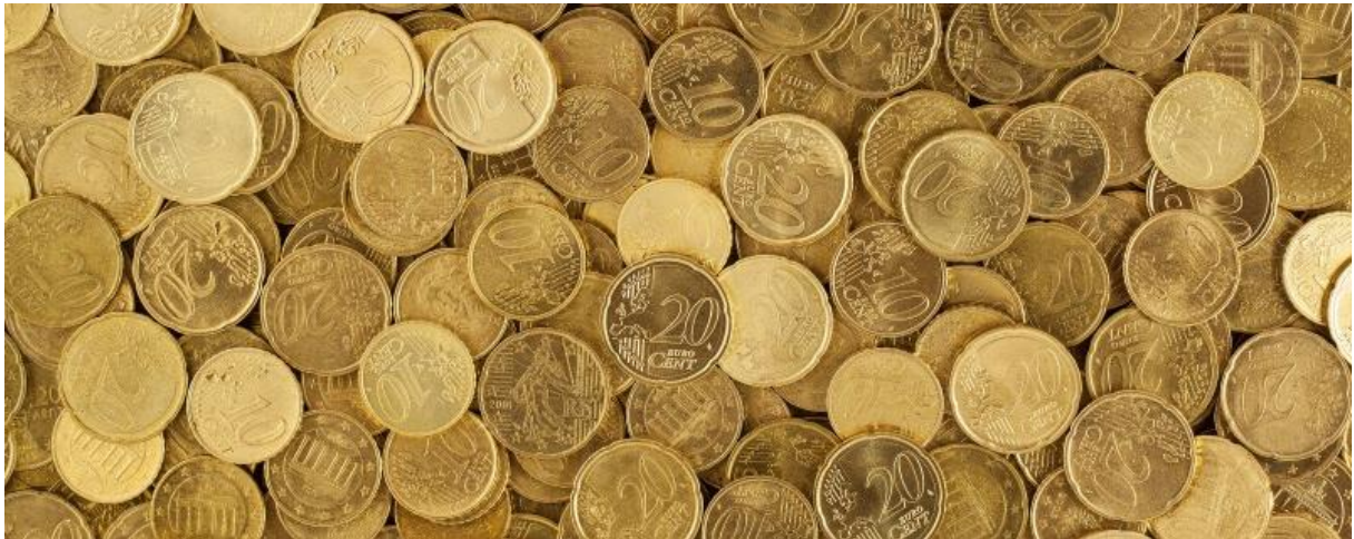
Figur 4. "Cash" av Harry Strauss via Stockio.

Det går förstås att söka efter bilder som har andra licenser än Creative Commons. Ett sätt att införskaffa material är att betala för det – bilder kan kosta från en hundralapp till ett par tusen beroende på kvalitet, användningsområde (tryck, webb, osv) och under hur lång tid bilden ska användas (exempelvis ett år, några år, obegränsat).