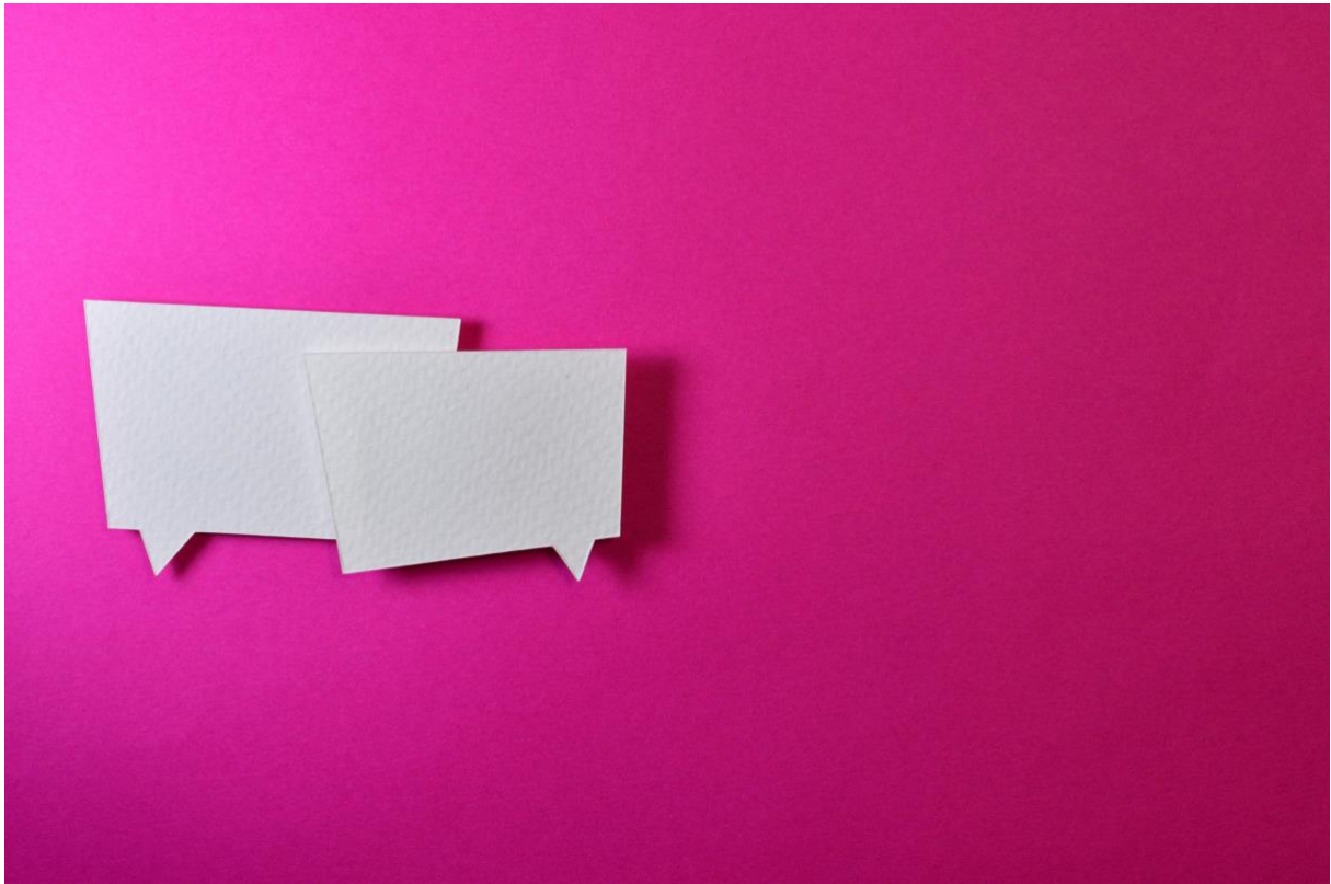
Figur 3.

Alla tjänster som listas i det här avsnittet innehåller material som är gratis att använda. Vid användandet måste upphovsmannen anges, dvs. ”attribution is required”, ett erkännande krävs. Se hur du skriver ett erkännande här . Många av tjänsterna ger automatiskt ett förslag på hur erkännande kan anges som bara är att kopiera. Det går att hitta material i dessa tjänster som är helt fritt att använda men tjänsterna listas här eftersom mycket av materialet åtföljs av CC-licenser som kräver erkännande.