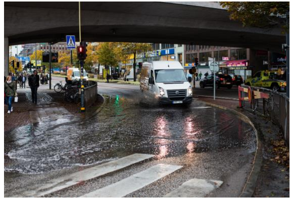
Licenserad under CC BY-NC-SA.

Om vi följer Creative Commons rekommendationer, och använder grundkällan till bilden kan det se ut så här: